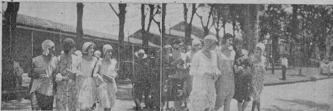
Grupos de encantadoras señoritas de nuestros círculos sociales a quienes se puede apreciar en el torneo de trajes y bellezas en los vermouth dominicales del Parque Central

En este día celebra la fecha gloriosa del aniversario de su emancipación política el Perú. Pueblo gigante, de una gran historia en América, está llamado a ocupar uno de los primeros puestos en el continente americano por su grandeza y por su progreso.